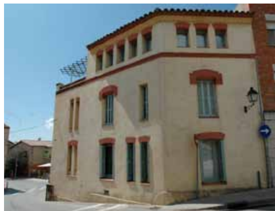
L'any 2000, la reforma integral de la casa va respectar el revestiment amb morter de calç concebit per Raspall.

El 1907, Joan Millet i Pagès, flamant propietari de la masia de Can Xammar de Dalt, encarrega a Raspall la reforma de Can Moncau amb la intenció de fer-hi recular la façana per tal de millorar l'accés dels automòbils a la seva propietat a través del carrer Major, molt estret en aquest punt concret. L'arquitecte projecta un nou llenç exterior de la casa d'acord amb els gustos modernistes, però marcat per una gran contenció formal: les finestres estan cobertes per un arc rebaixat de maons disposats verticalment i estan tancades amb persianes de llibret. Al ràfec, dues alineacions de teula n'emmarquen una altra de central amb forma de punta de diamant.