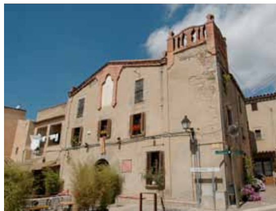
El capcer, la cornisa i la barana de maó que coronen el mas contrasten amb l'estucat de la façana.

El periodista i diplomàtic Eugeni Xammar (1888-1973), fill de l'hereva que es va vendre la masia familiar de l'Ametlla a l'industrial Joan Millet i Pagès, va ser un crític implacable de l'estil modernista que Raspall va implantar a diversos edificis de la vila durant la seva època d'arquitecte municipal. De les reformes que feia el projectista, Xammar en deia, amb ironia, "passar el raspall". Una de les obres de l'arquitecte que va suscitar més queixes per part de Xammar va ser la reforma de la masia de Can Bachs, a l'antiga plaça Vella, un casal del segle XVI al qual Raspall va afegir una torre amb una barana d'obra vista a l'angle dret i un capcer del mateix material que es prolonga al llarg de tota la cornisa i emmarca un rellotge de sol.