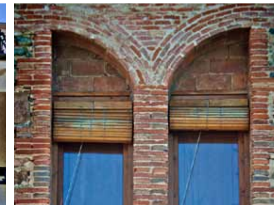
L'obra inacabada permet veure com es construeixen els arcs oposats de quart de punt del primer pis, a base de diverses capes de maó català posat pla.