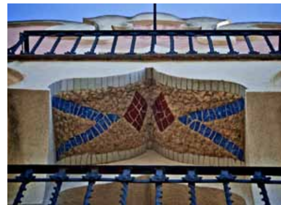
Combinació de pedra rústica y trencadís a la volta conopial sota el balcó superior.

Aquest edifici entre mitgeres consta de planta baixa i dos pisos, amb coberta de teula àrab a dues vessants, i va ser projectat per un arquitecte desconegut per a l'espardenyer Josep Blancher. La façana, simètrica, compta amb dos balcons superposats. El de baix està sostingut per un arc escarser que, estès cap avall, emmarca la porta principal de la casa, mentre que el del pis superior –més estret– es recolza sobre un arc conopial. A les decoracions de la façana –bàsicament els marcs de les obertures– hi predominen les línies corbes, que destaquen del llenç tant pel relleu com pel color. Al damunt de tot, l'acroteri de formes sinuoses inclou un medalló amb l'any de construcció i les inicials del promotor: J. B. 1906.