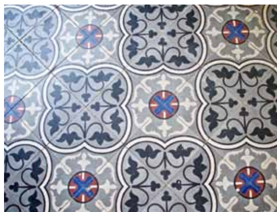
Mosaic hidràulic d'una de les estances de la Casa Viñas.