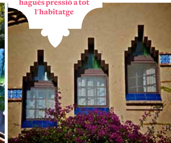
Les finestres de dintell esglaonat dominen les obertures de la planta baixa i les golfes.