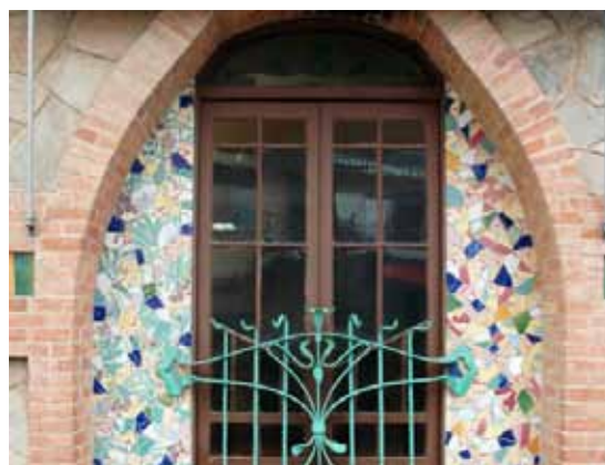
Protegides per baranes de ferro, les finestres de la planta baixa s'inscriuen dins de nínxols de maó que suggereixen la forma d'un arc catenari. L'espai interior s'omple de trencadís.

El doctor Sebastià Bassa, alcalde de la vila entre 1902 i 1915 i artífex de l'Ametlla contemporània juntament amb Raspall, va cedir uns terrenys al municipi per construir-hi un cafè-bar, que encara és actiu, i un teatre annex, molt reformat posteriorment. Raspall va concebre un edifici de planta baixa, dos pisos i coberta de teula àrab amb el carener paral·lel al carrer. La façana, simètrica i formada per tres eixos verticals, és de pedra capserrada, amb les obertures emmarcades per filades de maó, de formes diferents per a cada planta: amb arcs escarsers al segon pis, esglaonats al primer i catenaris als baixos. Dues motlures de rajoles verdes i grogues creuen l'edifici a l'alçada de la planta baixa i el primer pis.