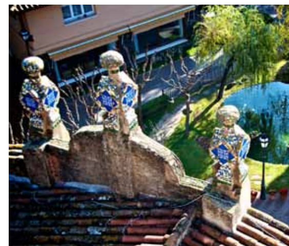
El capcer que culmina la façana principal està decorat amb rajoles de ceràmica i trencadís del mateix material.

Elements típics de les cases d'estiueig, les torres albergaven el dipòsit d'aigua que permetia que hi hagués pressió a tot l'habitatge