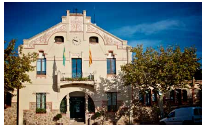
Al cos central de l'Ajuntament s'hi combinen elements decoratius rectilinis i curvilinis que donen dinamisme a la façana. El balcó, sostingut per mènsules esglaonades, i l'arc de mig punt de l'entrada doten el conjunt de la solemnitat pròpia d'un edifici oficial.

Actualment, l'Ajuntament ocupa les dues ales de l'antiga escola