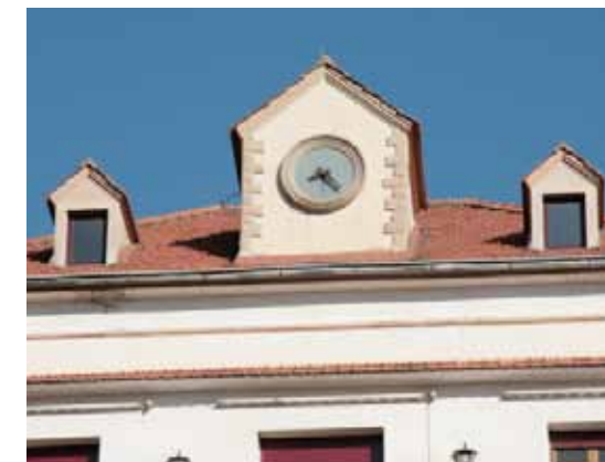
Orientat a ponent, el famós rellotge de la Villa Esperanza s'allotja a la més gran de les deu llucanes que sobresurten de la teulada.

Original per l'adaptació al pronunciadíssim pendent de la parcel·la i pels materials utilitzats en la solució adoptada –uns contraforts massius de pedra i maó–, aquesta casa va ser un dels primers habitatges d'estiueig al Figaró. Té planta rectangular i façanes als quatre vents, amb ornamentacions a base de trencadís de ceràmica amb motius geomètrics i vegetals, i era coneguda per tenir l'únic rellotge públic que hi havia a la vila, situat a la major de les deu llucanes que sobresurten del terrat i que atorguen un aire muntanyenc a l'edifici. El nivell superior, però, forma part d'una reforma posterior, portada a terme als anys 50, que va canviar profundament l'estil original de la casa.