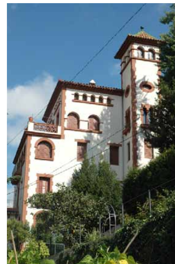
A la façana de migdia s'observa la distribució escalonada de l'edifici, amb la terrassa del pis noble, el cos d'aquest mateix habitatge i la torre adossada.

Estiuejant del Figaró arran de la recomanació d'un amic, Ramon Mestre va acabar essent un prohomer de la vila i fins i tot va organitzar i finançar la instal·lació d'aigua corrent al municipi.