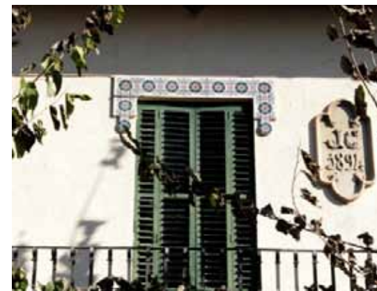
Un balcó de ferro unifica les tres obertures del primer pis. Els buits estan tancats amb persianes de llibret mòbil i emmarcats en la part superior per rajoles vidrades.

Situada, com l'Ajuntament i l'Hotel Congost, a la carretera de Ribes, la façana principal de Can Delgado mostra dos plafons que s'identifiquen amb les dates de construcció i reforma de la casa: 1894 i 1914, juntament amb les inicials dels promotors de les dues iniciatives. Aquests plafons són, sumats a les sanefes de rajoles de ceràmica vidrada amb motius geomètrics que decoren els arcs de les obertures, els principals recursos ornamentals de l'aquesta casa d'estiueig de planta baixa i pis, amb ingredients modernistes i, sobretot, noucentistes.