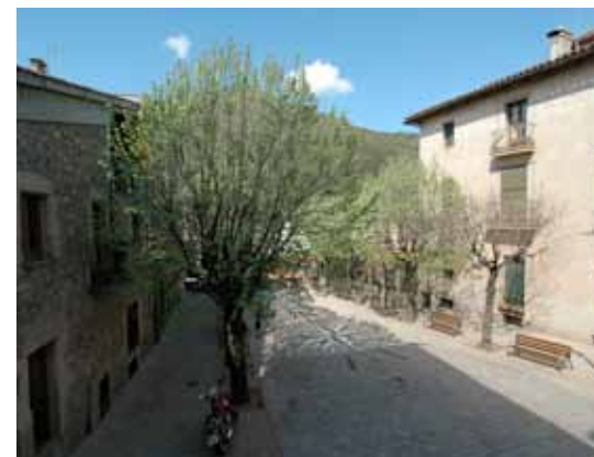
El fort desnivell marca el desenvolupament de la plaça Major, punt clau de l'exemple del nucli antic planificat arran de l'esclat del fenomen de l'estiuers a la vila.

A l'angle sud-est, en una posició alçada respecte del pla de la plaça, s'aixeca el casal noucentista de Can Ventureta, dominat per una torre-mirador amb coberta a quatre vessants que sobresurt formant un ampli ràfec decorat amb ceràmica de motius vegetals.