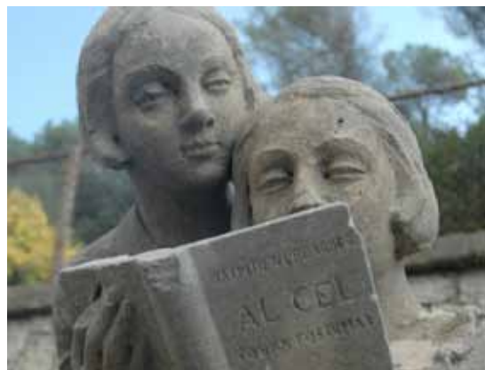
Detall de l'escultura del pilar dret del portal de Can Gambús en què es pot identificar l'obra que llegeixen els nens.

Els pilars que sostenen la reixa estan coronats per dues escultures que al·ludeixen a les activitats dels nens durant l'estiu, un recurs dotat del realisme i l'humanisme característics de l'art noucentista: uns juguen amb un gos i uns altres llegeixen Al cel , obra pòstuma de Jacint Verdaguer, poeta a qui es va dedicar el carrer al qual s'obre l'esmentat portal.