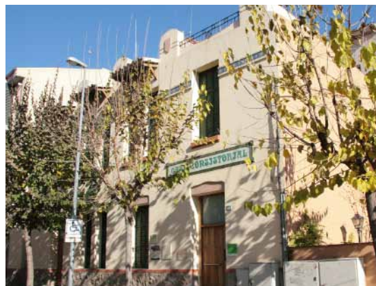
El coronament de l'edifici alterna trams de barana amb trams en què la teulada sobrepasa àmpliament la línia de la façana, mostrant un elegant revestiment de ceràmica.

Fins a principis del segle xx, el carrer Major –antic camí ral– va ser l'eix principal del Figaró. Arribada aquest època, però, el centre de gravetat de la vila es va desplaçar vint metres avall, a la carretera de Ribes, que discorre paral·lela al carrer Major i és més apta per al pas de vehicles i més pròxima a l'estació de tren. Allà s'hi va construir al 1910 la Casa Consistorial, obra de Josep Maria Miró i Guibernau, també autor de l'Hospital Asil de Granollers. L'edifici comprenia les oficines municipals, l'arxiu, l'escola i la casa de la mestra. Al 1998 es va portar a terme una profunda reforma dels espais interiors i la restauració de la façana modernista, provista d'esgrafiats florals i de sanefes de botons ceràmics. Després de les obres, l'edifici va quedar com a seu de l'Ajuntament en exclusiva.